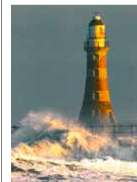
Beispiel: Der Musterkursteilnehmer entscheidet sich für das Bild eines von Wellen umwogten Leuchtturms, beleuchtet vom Sonnenlicht.

Die Bilder aus der ZRM-Bildkartei werden ausgelegt: Die Teilnehmenden wählen für sich ein Bild, das bei ihnen eindeutig nur positive Gefühle auslöst: Weite in der Brust, Wärme im Bauch, guten Bodenkontakt (→ somatische Marker) usw. Die ZRM-Trainerin achtet darauf, dass die Auswahl rasch und intuitiv erfolgt, also ohne lange zu überlegen.